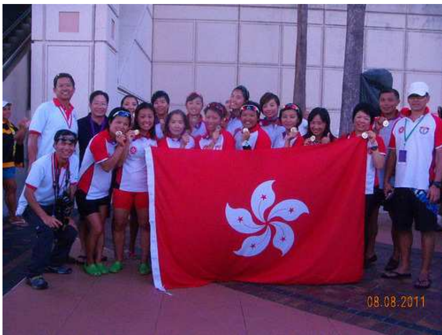
上圖：2011 年 8 月初 - 世界龍舟錦標賽在美佛羅里達州 Tampa 市舉行，香港女子隊獲小龍賽金牌，並與當時在場的香港國際裁判合攝。