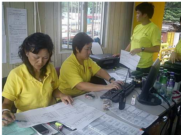
圖：警察龍舟會慈善龍舟賽 - 裁判秘書組正忙於工作 2011.10.15 (星期六)